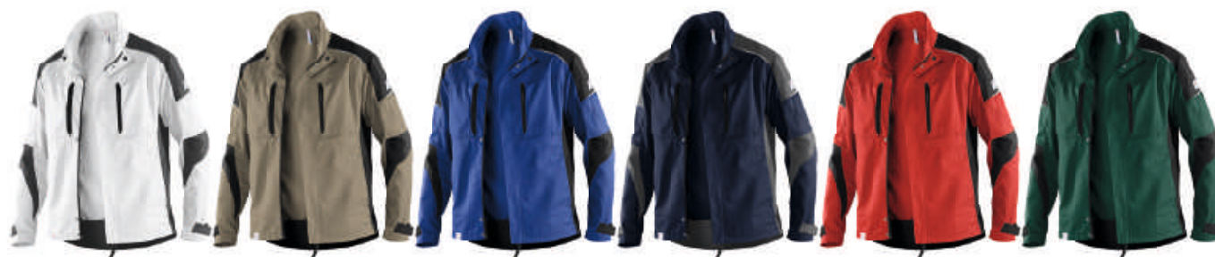
Weiß | Anthrazit 1250 5365-1097 XS-4XL