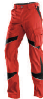
Mittelrot | Schwarz 2550 5365-5599 D34-D54