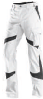
Weiß | Anthrazit 2550 5365-1097 D34-D54