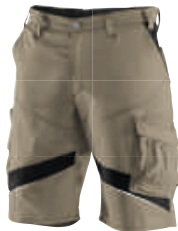
Sandbraun | Schwarz 2450 5365-2599 40-66