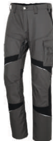
Anthrazit | Schwarz 2150 5365-9799 40-66, 90-118, 25-31