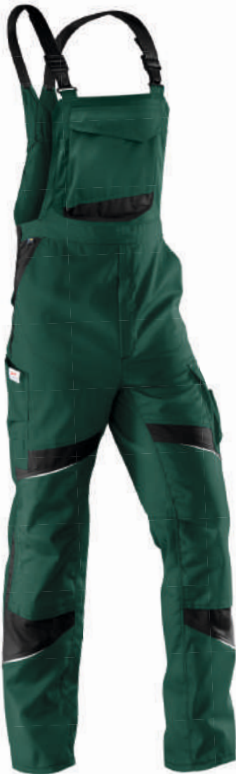
Moosgrün | Schwarz 3250 5365-6599 40-66, 90-118, 23-31