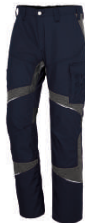
Dunkelblau | Anthrazit 2150 5365-4897 40-66, 90-118, 25-31