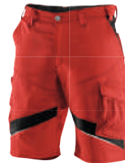
Mittelrot | Schwarz 2450 5365-5599 40-66