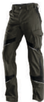
Oliv | Schwarz 2550 5365-6699 D34-D54