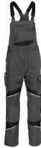
Anthrazit | Schwarz 3450 3421-9799 40-66, 90-118, 23-31