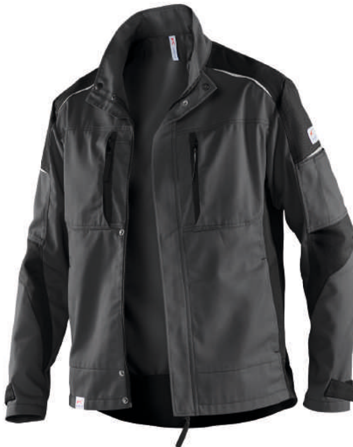
Anthrazit | Schwarz 1250 5365-9799 XS-4XL