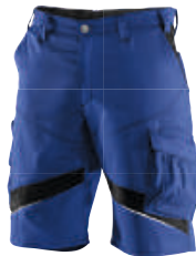
Kbl.blau | Schwarz 2450 5365-4699 40-66