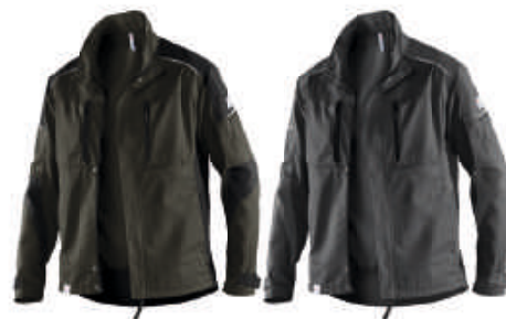
Oliv | Schwarz 1250 5365-6699 XS-4XL