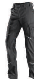
Schwarz 2550 5365-99 D34-D54