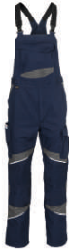
Dunkelblau | Anthrazit 3450 3421-4897 40-66, 90-118, 23-31