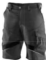
Anthrazit | Schwarz 2450 5365-9799 40-66