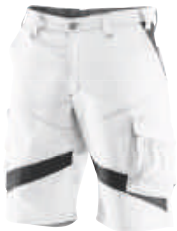
Weiß | Anthrazit 2450 5365-1097 40-66