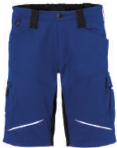
Kbl.blau | Schwarz 2950 5231-4699 40-64