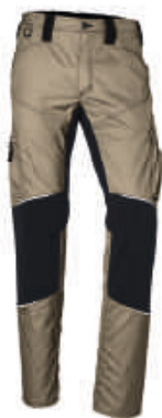
Sandbraun | Schwarz 2850 5231-2599 40-66, 90-118, 23-31