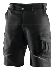
Schwarz 2450 5365-99 40-66