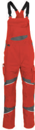
Mittelrot | Anthrazit 3450 3421-5597 40-66, 90-118, 23-31