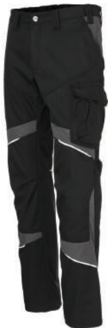
Schwarz | Anthrazit 2550 3421-9997 D34-D54