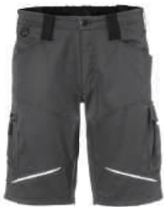
Anthrazit 2950 5231-97 40-64