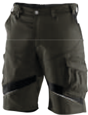
Oliv | Schwarz 2450 5365-6699 40-66