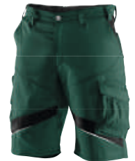
Moosgrün | Schwarz 2450 5365-6599 40-66