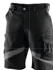
Schwarz | Anthrazit 2450 5365-9997 40-66