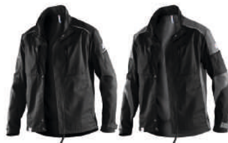
Schwarz 1250 5365-99 XS-4XL