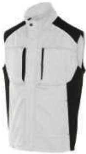
Weiß | Anthrazit 7250 5365-1097 XS-4XL