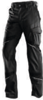
Anthrazit 2550 5365-97 D34-D54