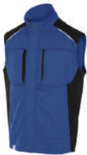
Kbl.blau | Schwarz 7250 5365-4699 XS-4XL