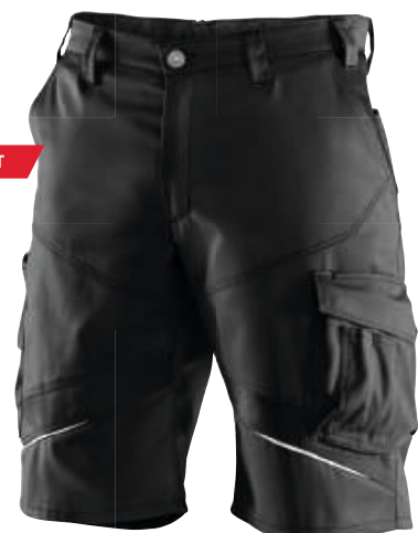
Schwarz 2650 5365-99 D34-D54