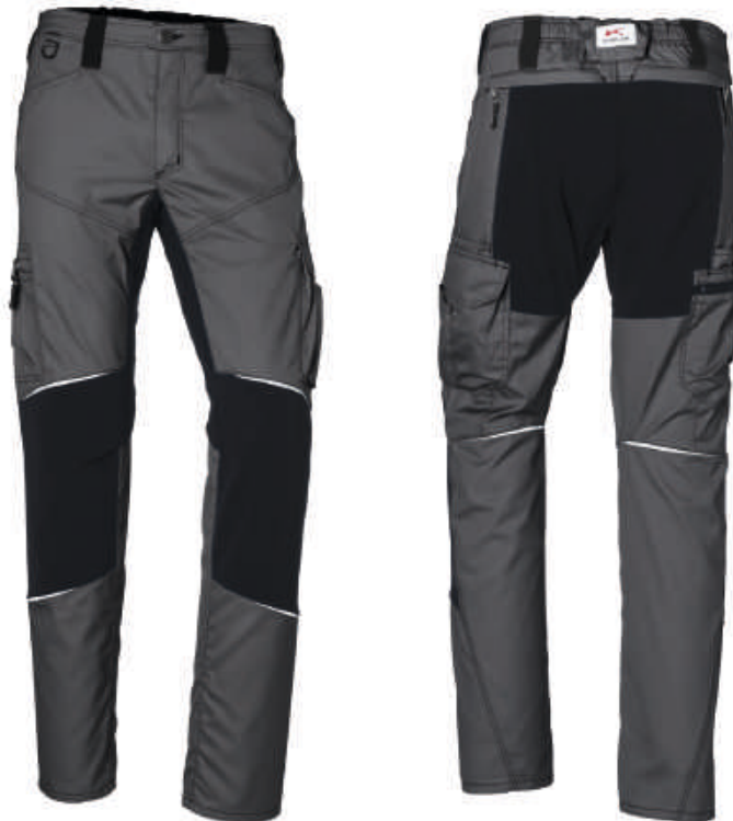
Anthrazit | Schwarz 2850 5231-9799 40-66, 90-118, 23-31