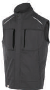
Anthrazit 7250 5365-97 XS-4XL