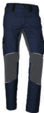
Dunkelblau | Anthrazit 2850 5231-4897 40-66, 90-118, 23-31