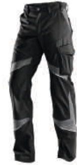
Schwarz | Anthrazit 2550 5365-9997 D34-D54