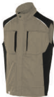
Sandbraun | Schwarz 7250 5365-2599 XS-4XL