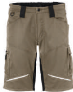
Sandbraun | Schwarz 2950 5231-2599 40-64