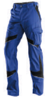
Kbl.blau | Schwarz 2550 5365-4699 D34-D54