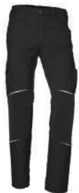
Schwarz 2850 5231-99 40-66, 90-118, 23-31