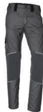
Anthrazit 2850 5231-97 40-66, 90-118, 23-31