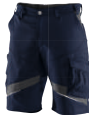
Dunkelblau | Anthrazit 2450 5365-4897 40-66