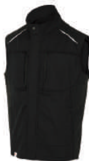
Schwarz 7250 5365-99 XS-4XL