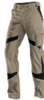
Sandbraun | Schwarz 2550 5365-2599 D34-D54