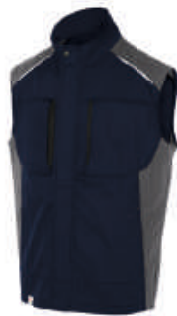
Dunkelblau | Anthrazit 7250 5365-4897 XS-4XL