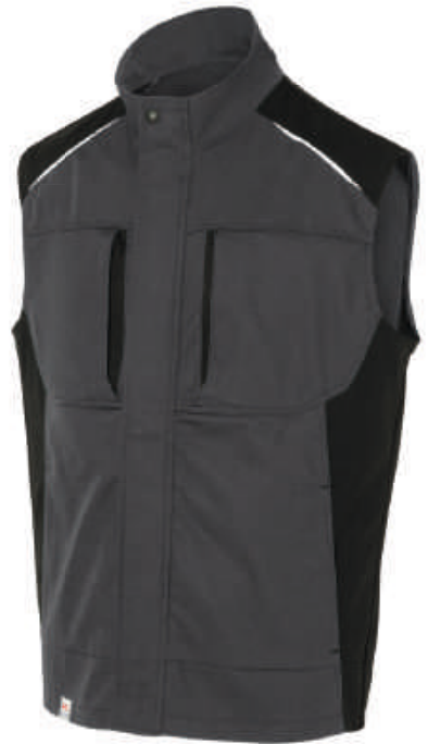
Anthrazit | Schwarz 7250 5365-9799 XS-4XL