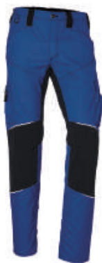
Kbl.blau | Schwarz 2850 5231-4699 40-66, 90-118, 23-31