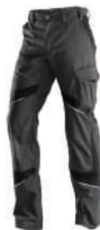
Anthrazit | Schwarz 2550 5365-9799 D34-D54