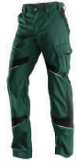
Moosgrün | Schwarz 2550 5365-6599 D34-D54