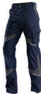
Dunkelblau | Anthrazit 2550 5365-4897 D34-D54