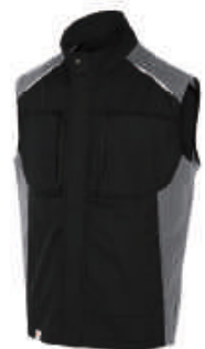
Schwarz | Anthrazit 7250 5365-9997 XS-4XL