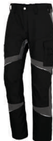
Kbl.blau | Schwarz 2150 5365-4699 40-66, 90-118, 25-31