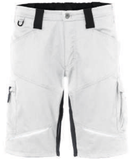
Weiß | Anthrazit 2950 5231-1097 40-64