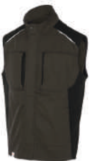
Oliv | Schwarz 7250 5365-6699 XS-4XL