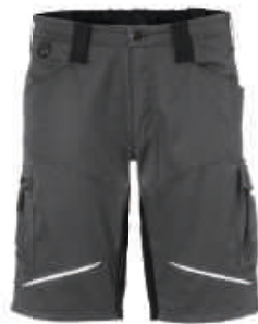
Anthrazit | Schwarz 2950 5231-9799 40-64