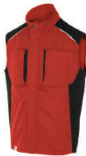
Mittelrot | Schwarz 7250 5365-5599 XS-4XL