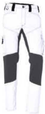
Weiß | Anthrazit 2850 5231-1097 40-66, 90-118, 23-31