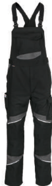
Schwarz | Anthrazit 3450 3421-9997 40-66, 90-118, 23-31