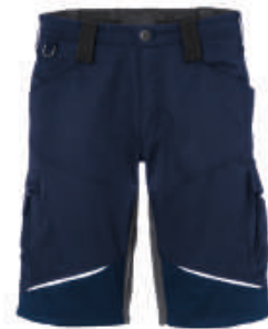
Dunkelblau | Anthrazit 2950 5231-4897 40-64