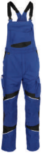
Kbl.blau | Schwarz 3450 3421-4699 40-66, 90-118, 23-31