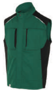
Moosgrün | Schwarz 7250 5365-6599 XS-4XL