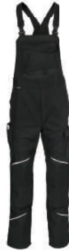
Schwarz 3450 3421-99 40-66, 90-118, 23-31