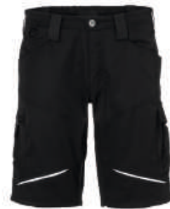
Schwarz 2950 5231-99 40-64