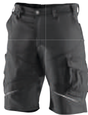
Anthrazit 2450 5365-97 40-66